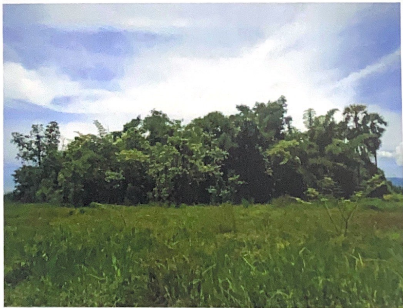
สภาพพื้นที่โดยรอบวัดม่วง (ร้าง)