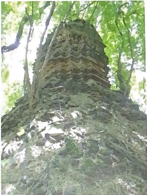
เจดีย์ของวัดม่วง (ร้าง)