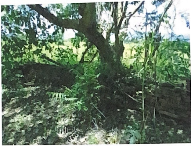
แนวกำแพงของวัดม่วง (ร้าง)