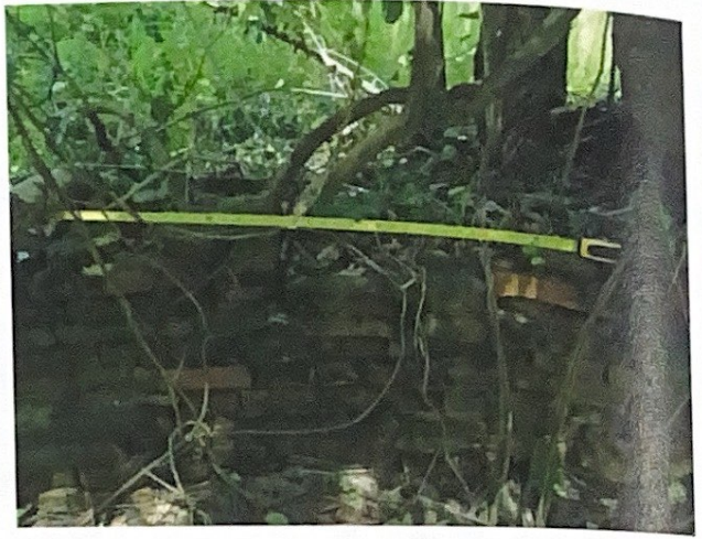
แนวกำแพงของวัดม่วง (ร้าง)