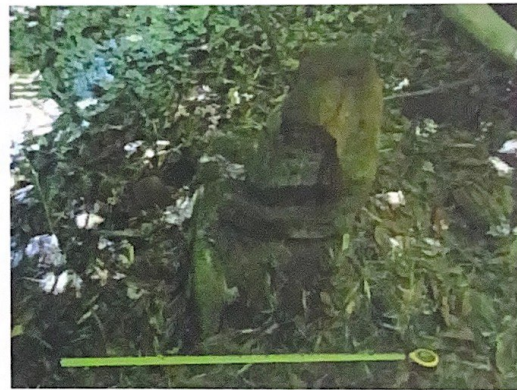
พระพุทธรูปที่พบในบริเวณวัดม่วง (ร้าง)