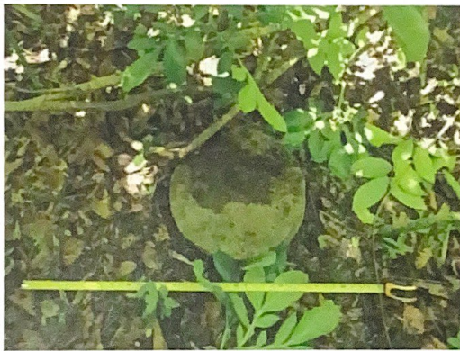
ฐานเสาวิหาร? ที่พบในบริเวณวัดม่วง (ร้าง)