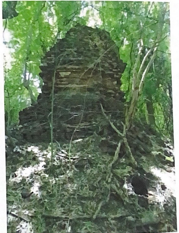
เจดีย์ของวัดม่วง (ร้าง)