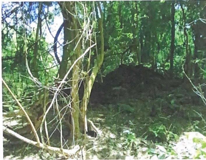
เนินโบราณสถานและฐานอาคารอีกหลังของวัดม่วง (ร้าง)