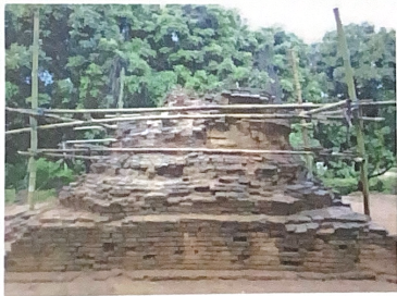
ฐานอาคารภายในวัดป่าแดง (ร้าง)