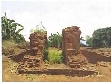
โขงประตูของวัดป่าแดง (ร้าง)