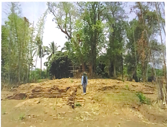
สภาพทั่วไปภายในวัดป่าแดง (ร้าง)