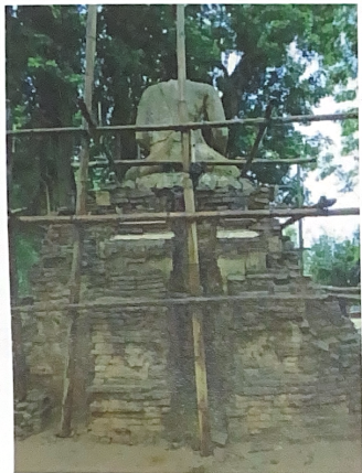
พระพุทธรูปบนฐานชุกชีภายในวัดป่าแดง (ร้าง)