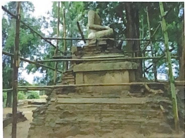
พระพุทธรูปบนฐานชุกชีอีกมุมหนึ่ง ภายในวัดป่าแดง (ร้าง)