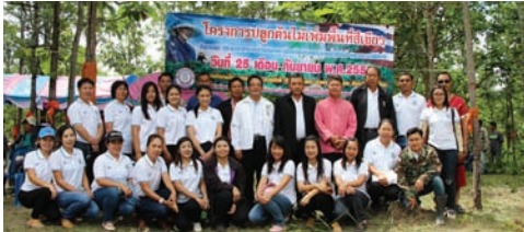
โครงการประชาสัมพันธ์ป่าเฉลิมพระเกียรติ สมเด็จพระนางเจ้าสิริกิติ์ พระบรมราชินีนาถ

เทศบาลตำบลบ้านจัดโครงการประชาสัมพันธ์ป่าเฉลิมพระเกียรติสมเด็จพระนางเจ้าสิริกิติ์ พระบรมราชินีนาถ เพื่อเป็นการแสดงความจงรักภักดีและสำนึกในพระกรุณาธิคุณ สมเด็จพระนางเจ้าสิริกิติ์ฯ ที่ทรงให้ความสำคัญกับป่าไม้มาโดยตลอด ณ พื้นที่ตำบลบ้านแปะตามโครงการในพระราชดำริ หมู่ 10, 11, 15 และ 18 พื้นที่ดำเนินการ จำนวน 10 ไร่ เมื่อวันที่ 25 กันยายน 2557