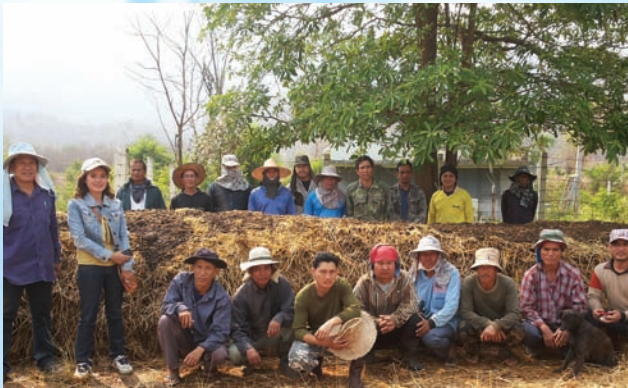
โครงการส่งเสริมเกษตรอินทรีย์และ ฟื้นฟูสิ่งแวดล้อม การย่อยกิ่งไม้เศษวัสดุ เหลือทิ้งทางการเกษตร เมื่อวันที่ 20-22 มีนาคม 2557