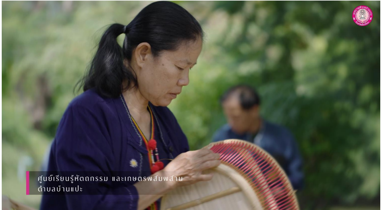
ศูนย์เรียนรู้หัตถกรรม และเกษตรผสมผสาน ตำบลบ้านแปะ